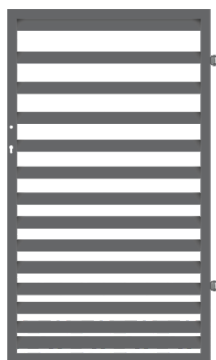
GÅNGGRIND (HÖGERHÄNGD) 1,50 x 0,90 m