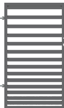
GÅNGGRIND (VÄNSTERHÄNGD) 1,50 x 0,90 m